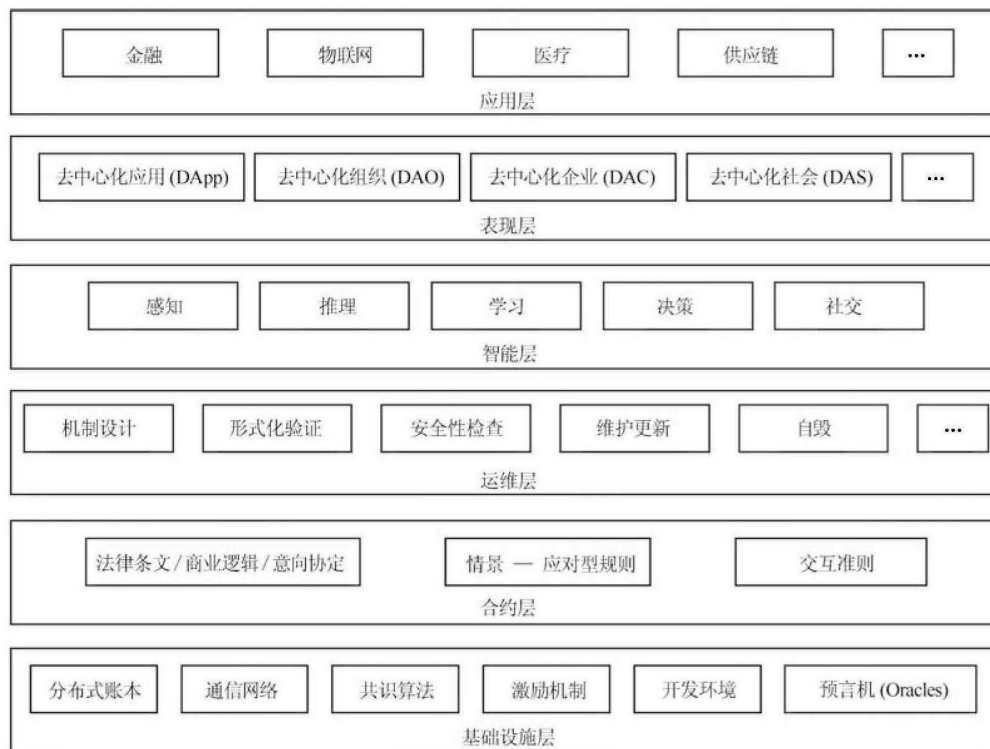
图2 智能合约基础架构模型