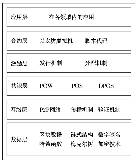
图 1 区块链六层架构

中本聪 [2] 将区块链系统划分为数据层、网络层、共识层与激励层。中国工业和信息化部 [3] 将区块链 2.0 阶段的区块链架构划分为数据层、网络层、共识层、激励层与智能合约层。袁勇等研究者 [31] 将区块链划分为数据层、网络层、共识层、激励层、合约层与应用层。本文采用如图 1 所示的区块链六层架构模型。